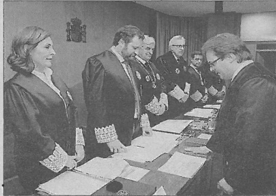
El acto se celebró en los juzgados de Vigo.